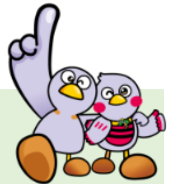
埼玉県マスコット コバトン・さいたまっちゃん